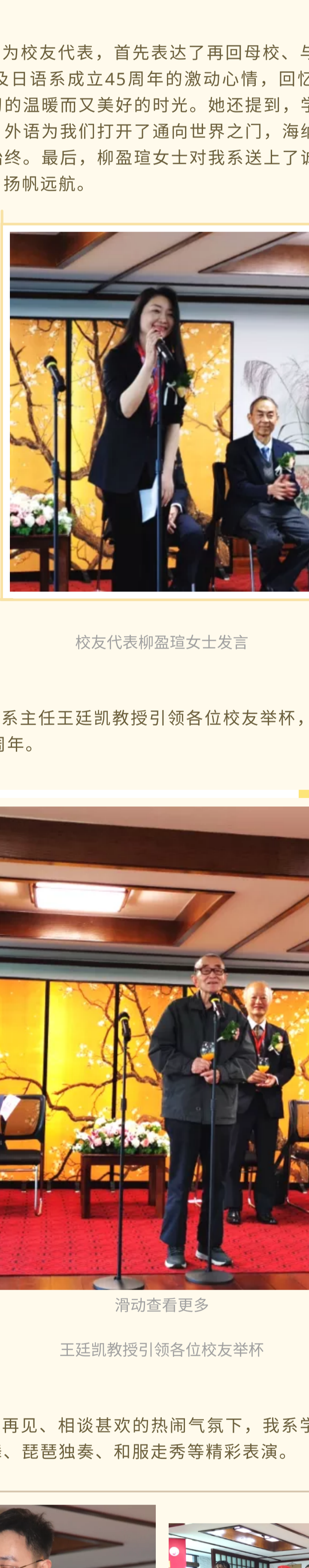
总领事渡边信之先生致辞

总领事渡边信之先生首先对四川外国语大学70华诞以及日语系成立45周年致以衷心的祝贺。紧接着，渡边先生还表达了对日语系未来发展的密切关心，也欣慰地看到中日关系如今越来越密切与友好。